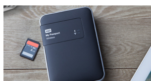
15/10/2014 La prova interattiva: My Passport Wireless, l'hard disk pensato per lo smartphone