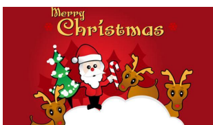
12/12/2014 Le 50 migliori copertine natalizie per Facebook